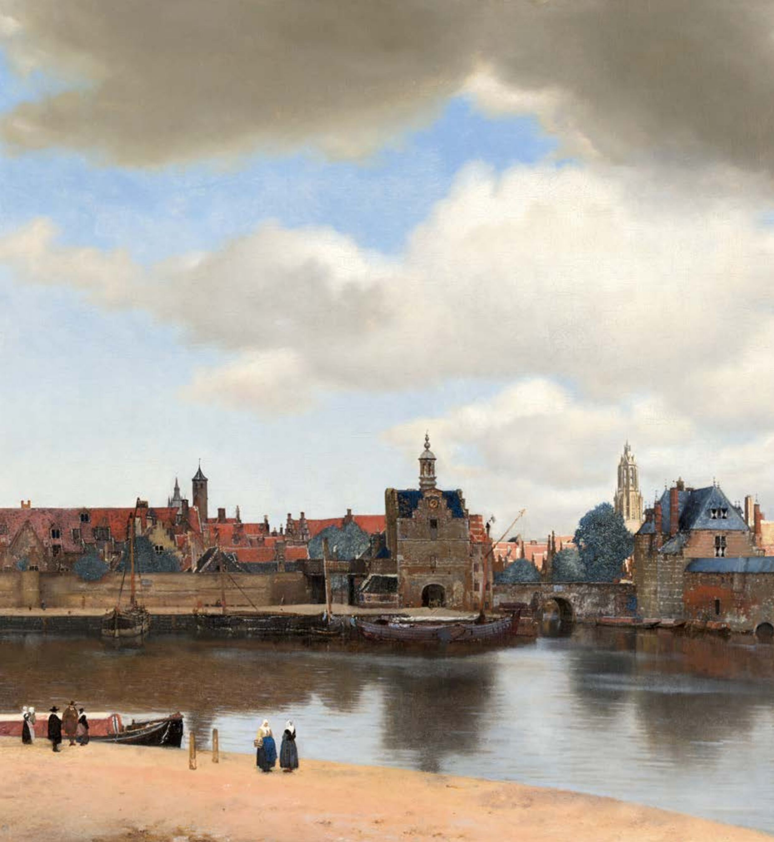
Johannes Vermeer, Gezicht op Delft , c. 1660-1661