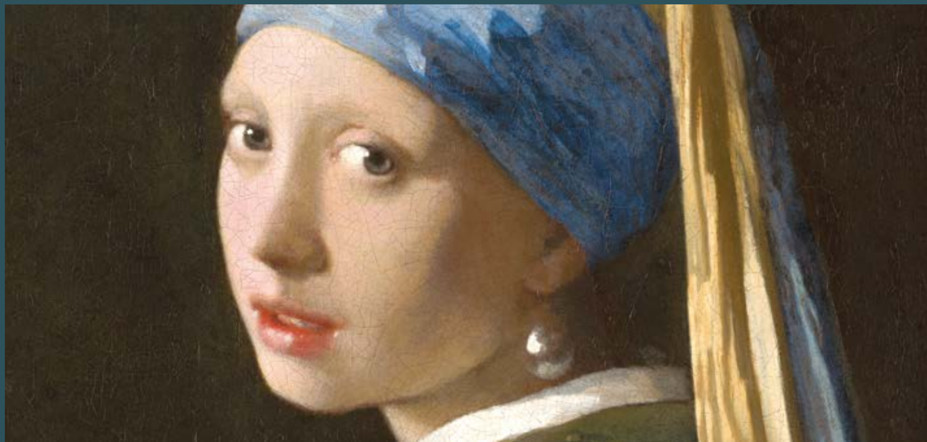
Johannes Vermeer, Meisje met de parel , c. 1665

Het Mauritshuis is een klein museum van wereldklasse met een formidabele collectie Nederlandse en Vlaamse schilderijen uit de 17e eeuw. In het Mauritshuis ontdek je in 1.5 uur iconische meesterwerken, zoals het Meisje met de parel van Johannes Vermeer, De anatomische les van Dr. Nicolaes Tulp van Rembrandt en Het puttertje van Fabritius. Zodra je het Mauritshuis binnenkomt, ervaar je de liefde voor deze oude meesters, en merk je dat die eeuwenoude kunst nog steeds springlevend is.