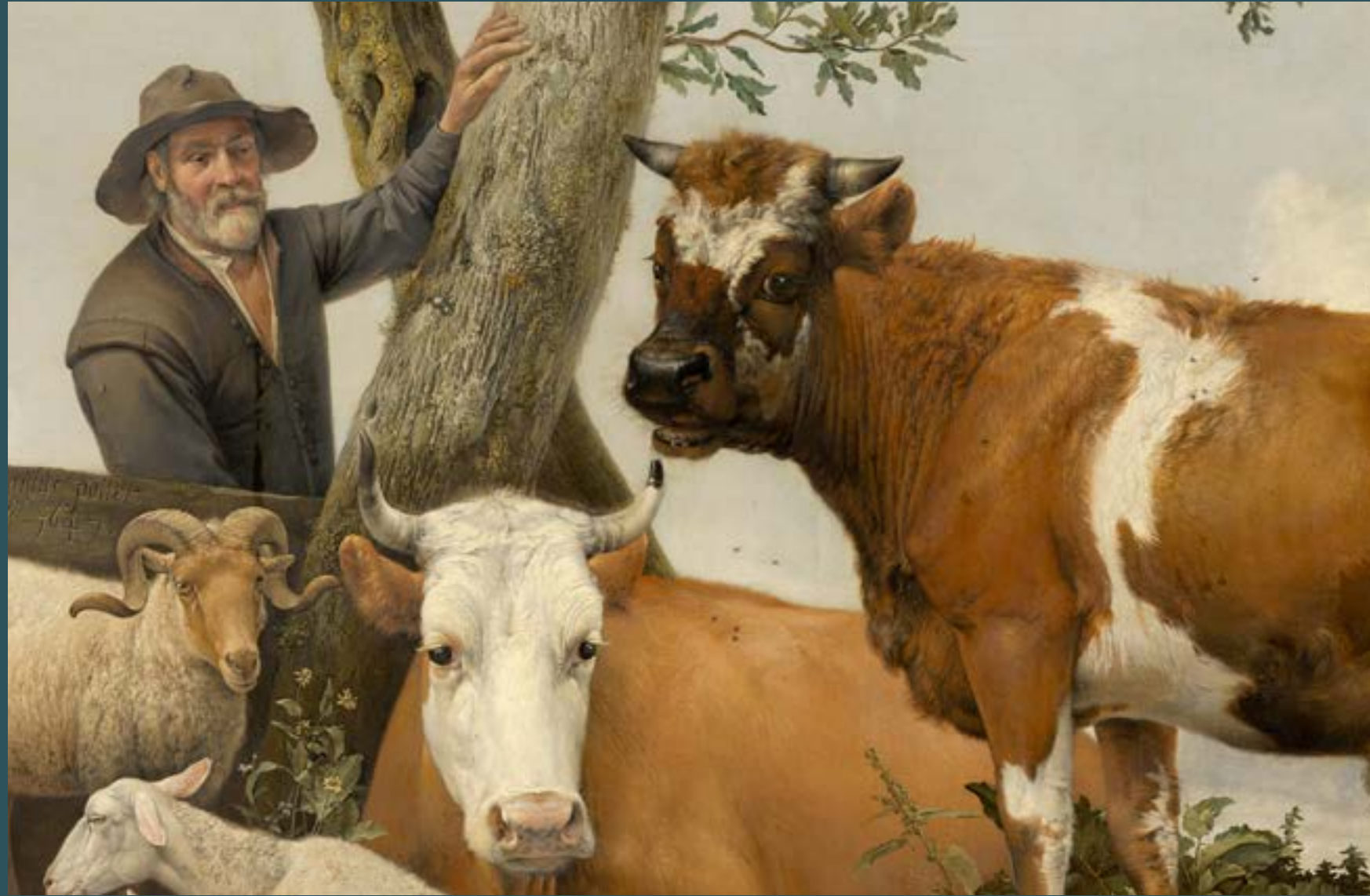
Paulus Potter, De Stier , 1647