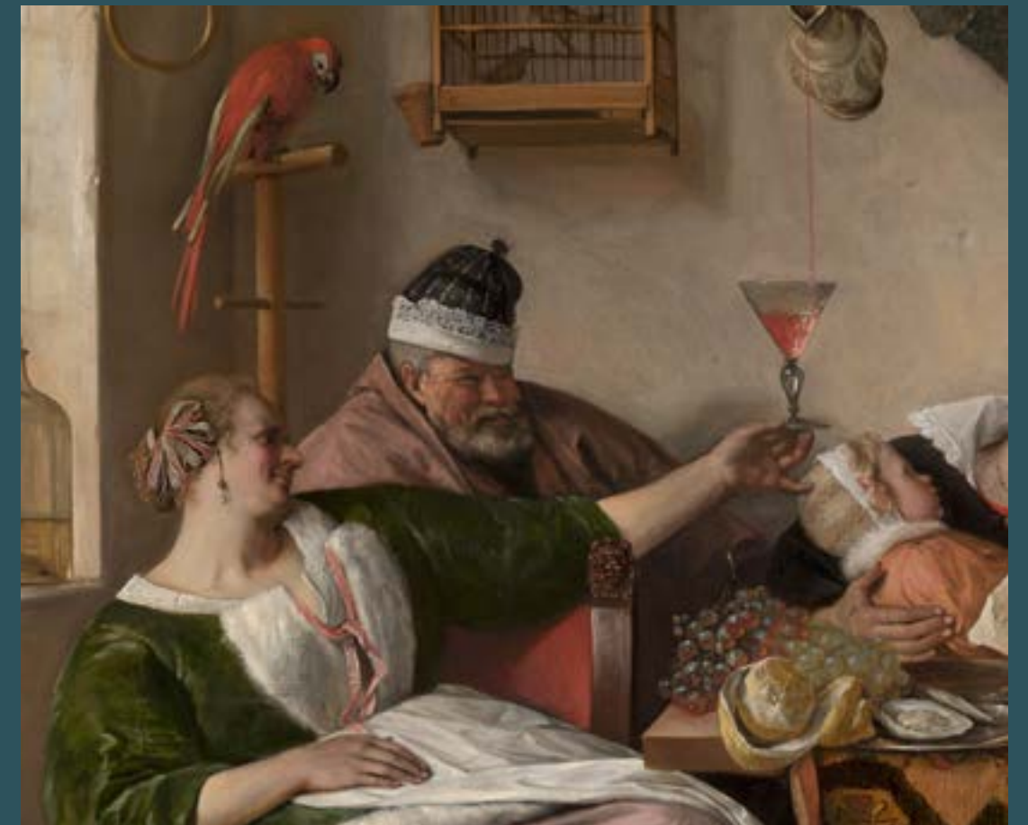
Jan Steen, 'Soo voer gesongen, soo na gepepen' , c. 1668-1670