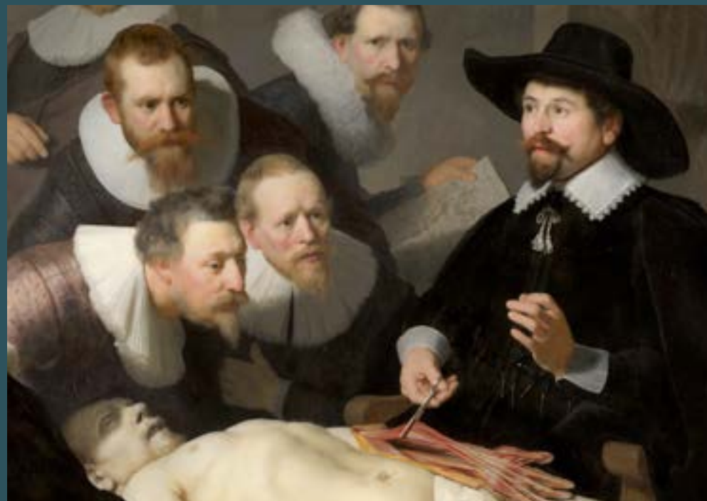
Rembrandt, De anatomische les van Dr. Nicolaes Tulp , 1632