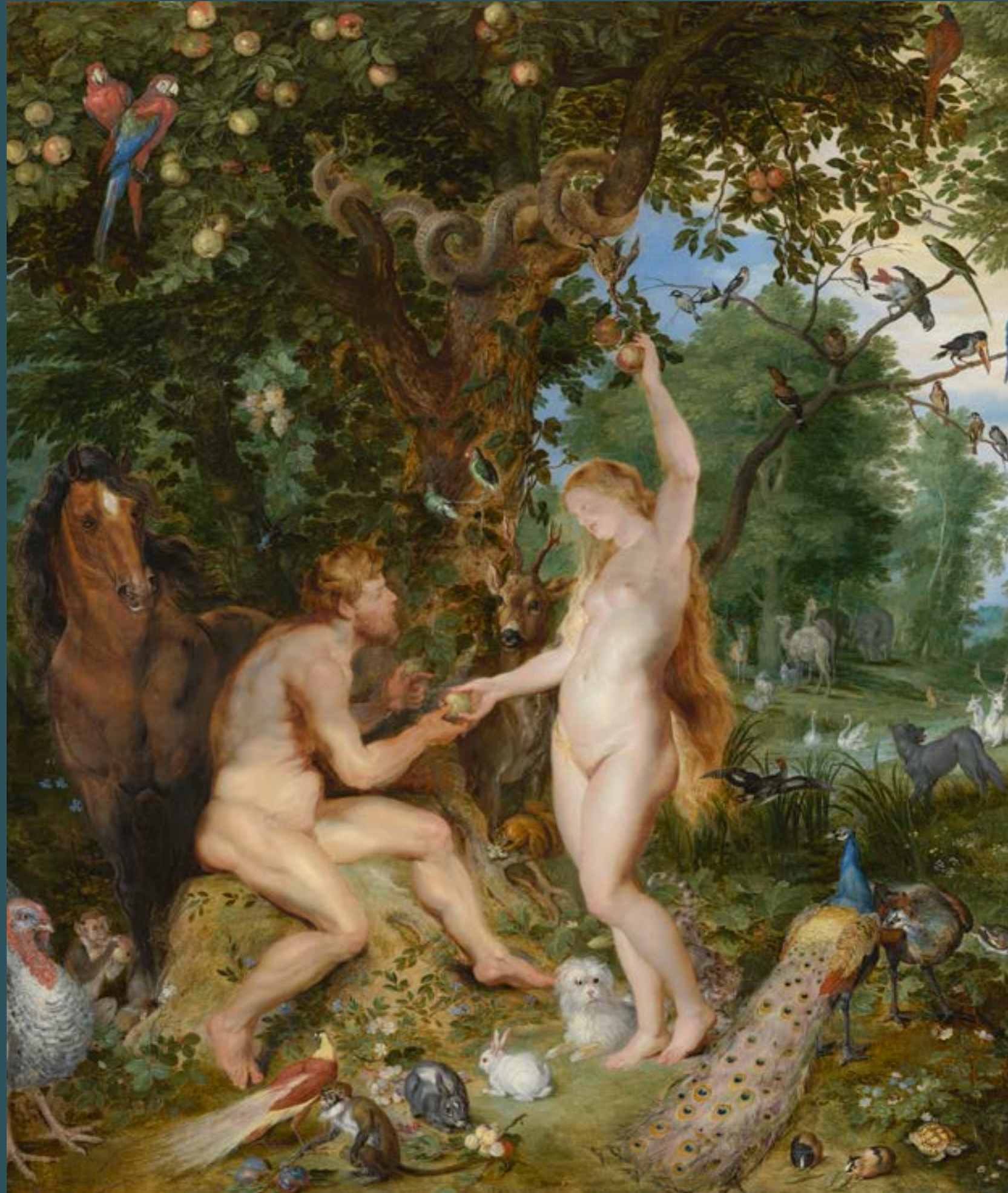
Jan Brueghel de Oude & Peter Paul Rubens, Het aardse paradijs met de zondeval van Adam en Eva , 1615