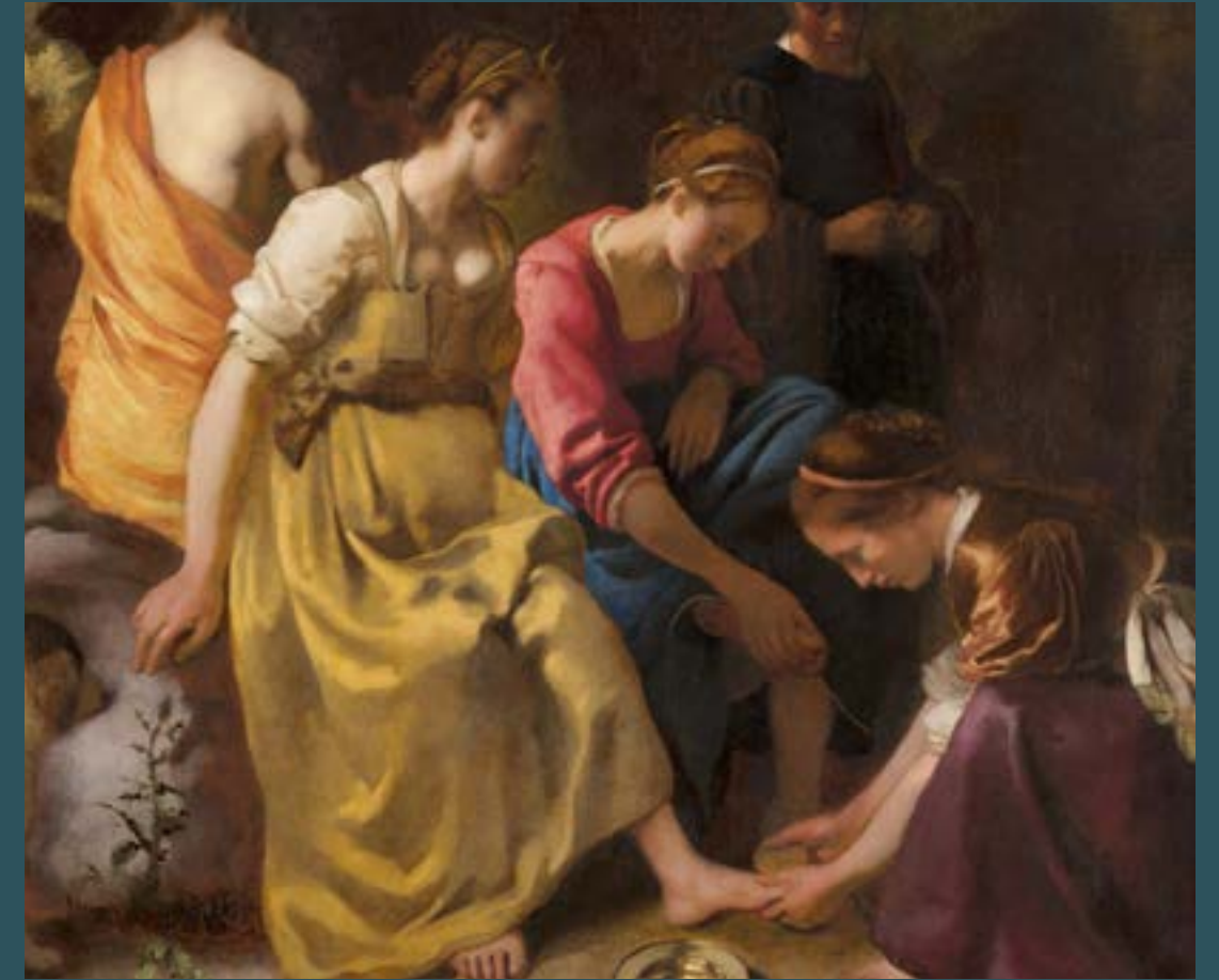
Johannes Vermeer, Diana en haar nimfen , c. 1653-1654