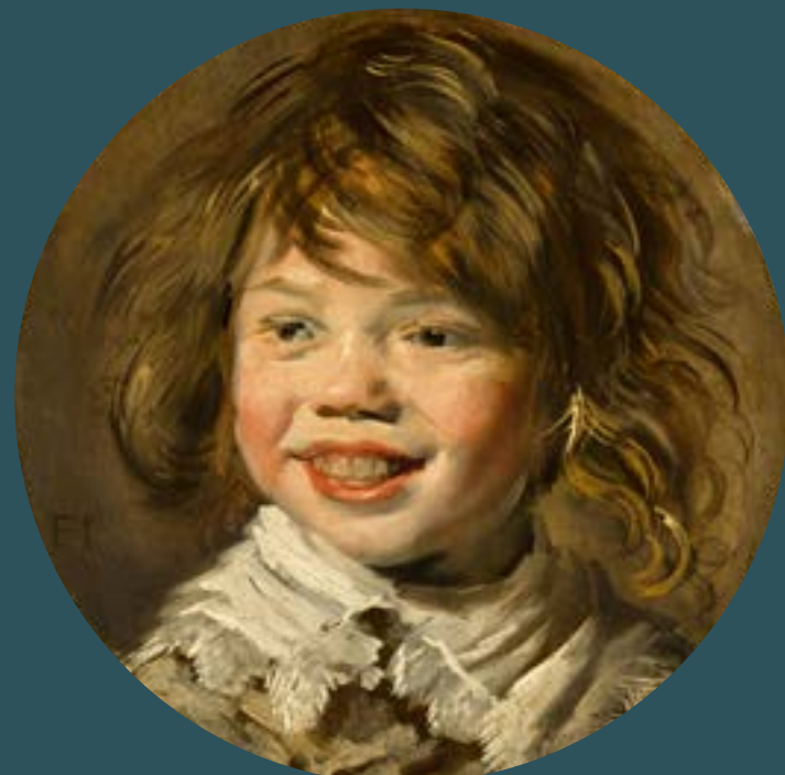
Frans Hals, Lachende jongen , c. 1625