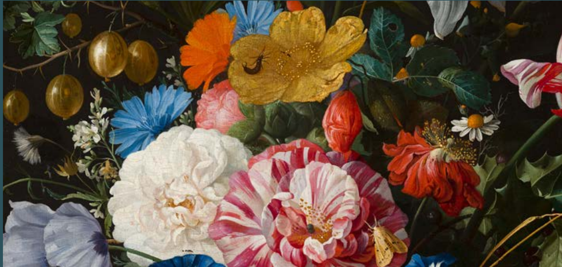
Jan Davidsz de Heem, Vaas met bloemen , 1670