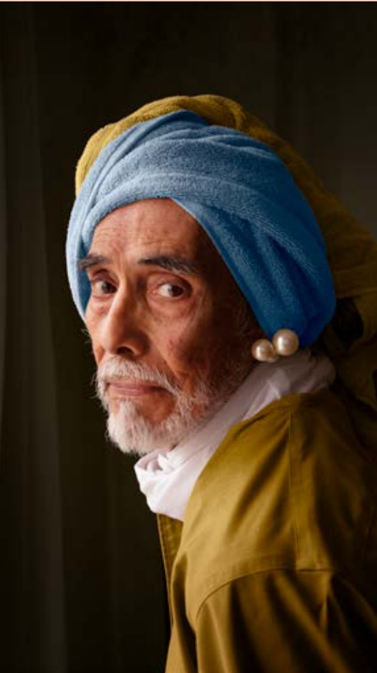
My Girl with a Pearl