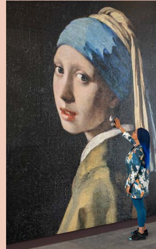
Who's that Girl?