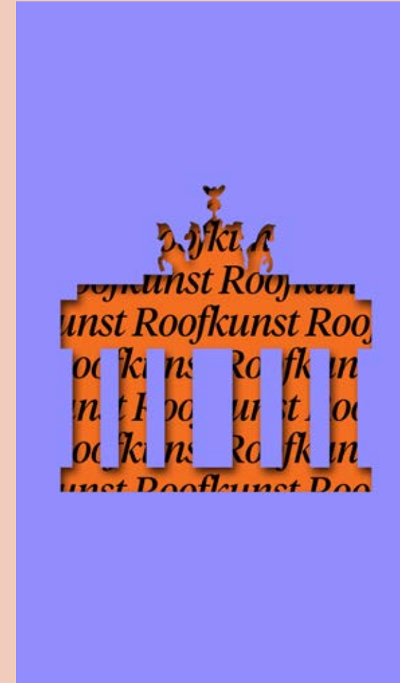
Roofkunst – 10 verhalen