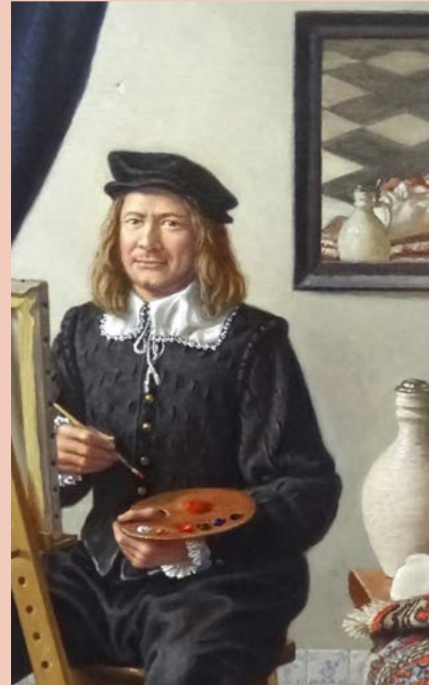
De Nieuwe Vermeer