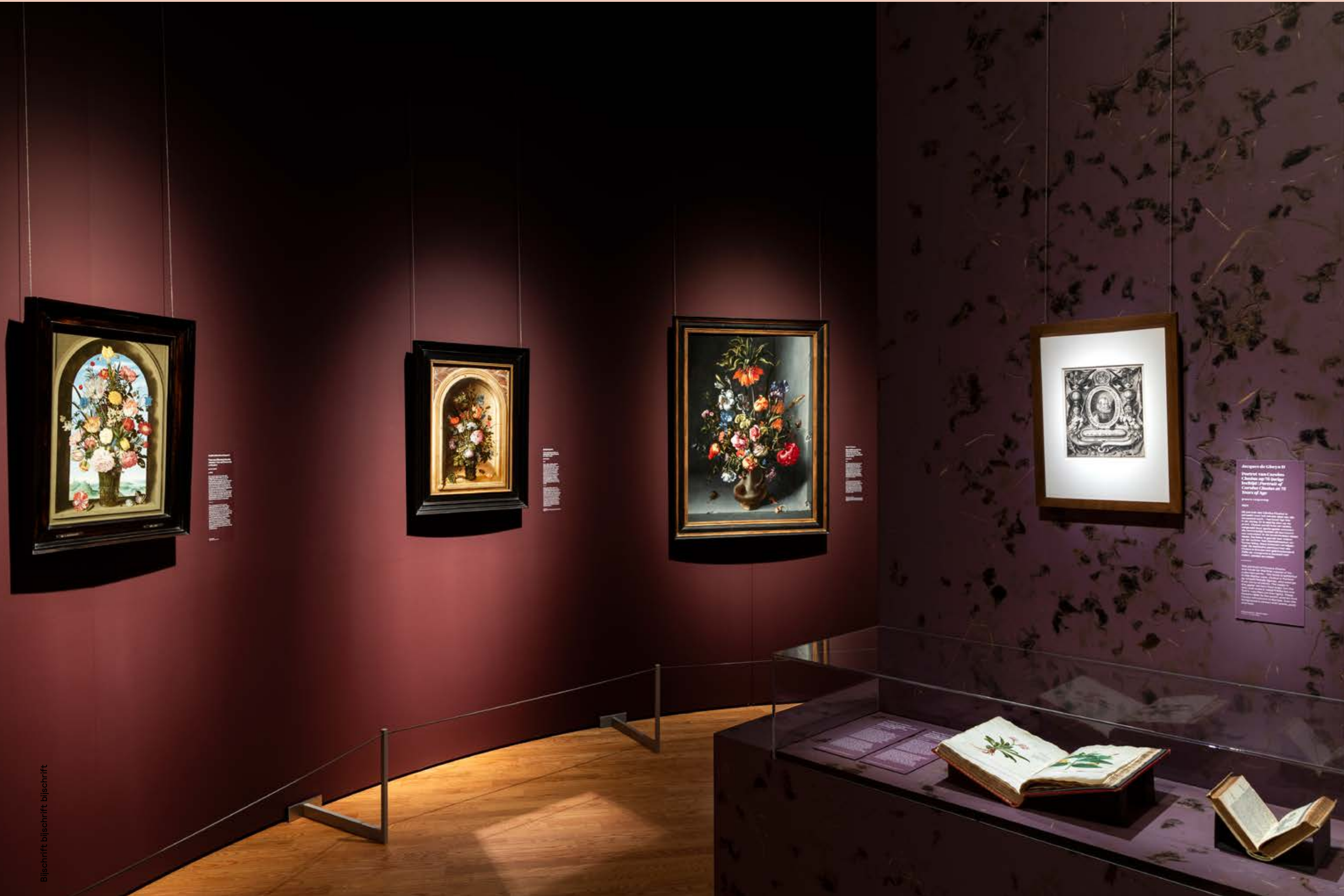
Bijchrift, bijchrift, bijchrift