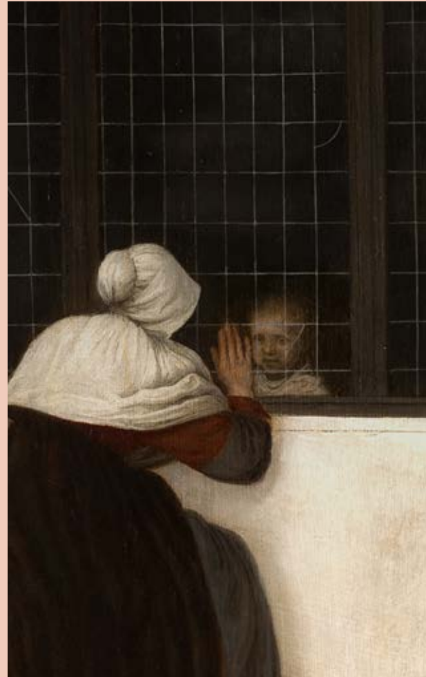
Vrel, voorloper van Vermeer