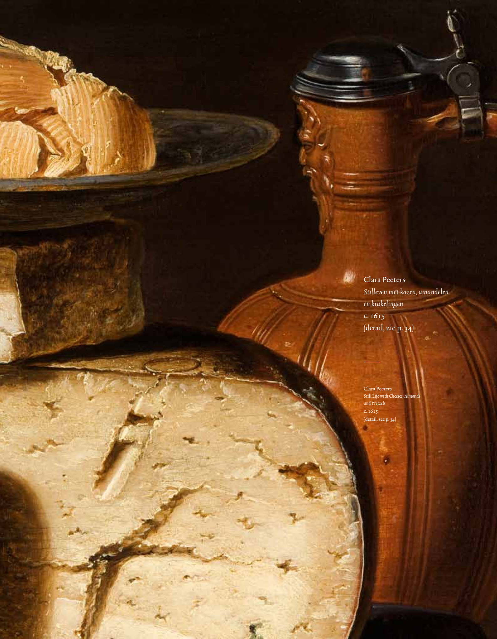
Clara Peeters Stillven met kazen, amandelen en krakelingen c. 1615 (detail, zie p. 34)