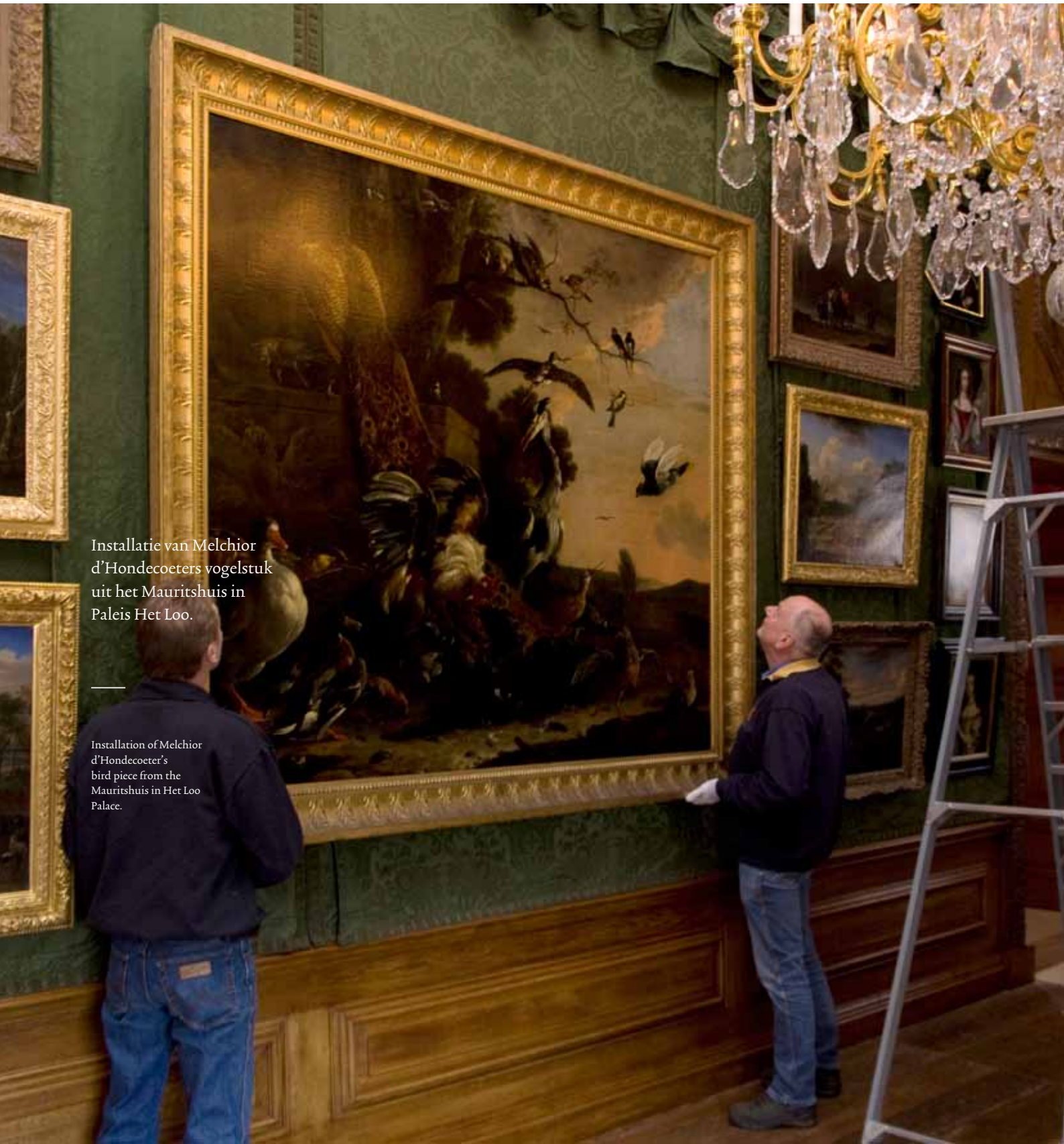
Installatie van Melchior d'Hondecoeters vogelstuk uit het Mauritshuis in Paleis Het Loo.