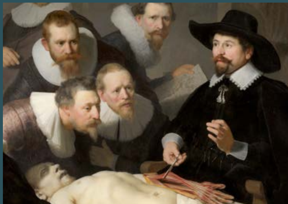
Rembrandt, De anatomische les van Dr. Nicolaes Tulp , 1632