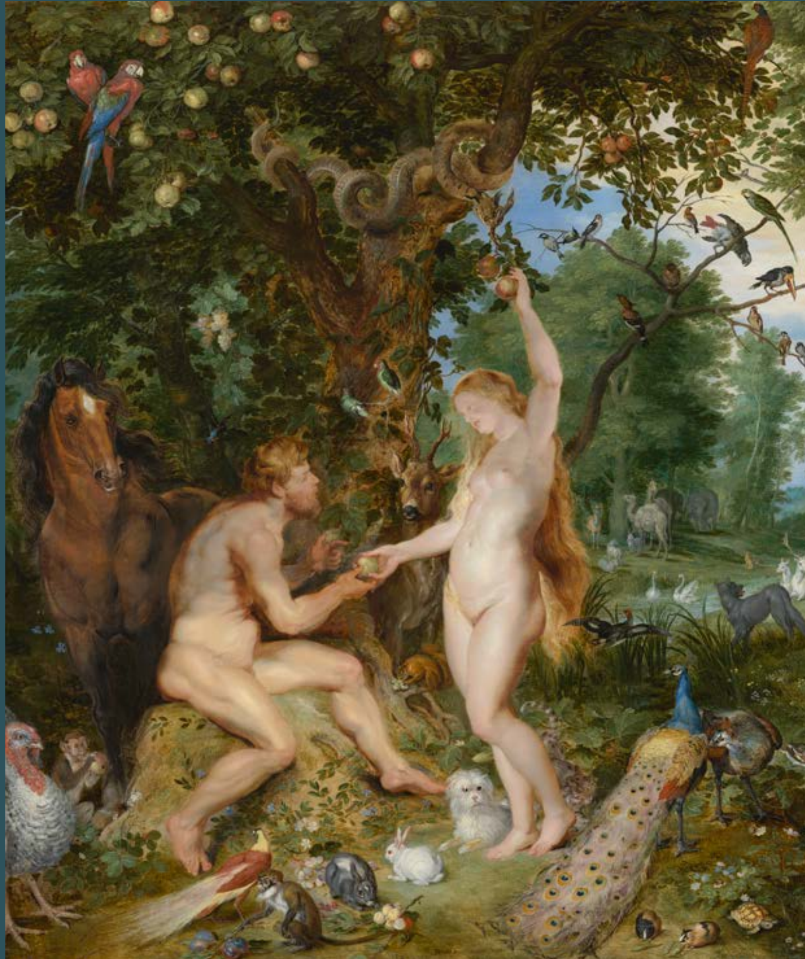
Jan Brueghel de Oude & Peter Paul Rubens, Het aardse paradijs met de zondeval van Adam en Eva , 1615