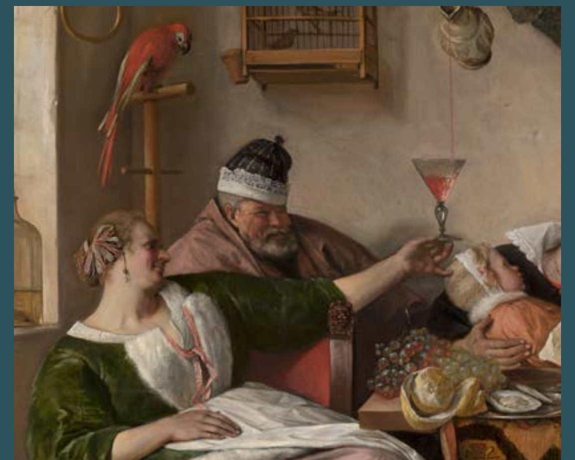
Jan Steen, 'Soo voer gesongen, soo na gepepen' , c. 1668-1670