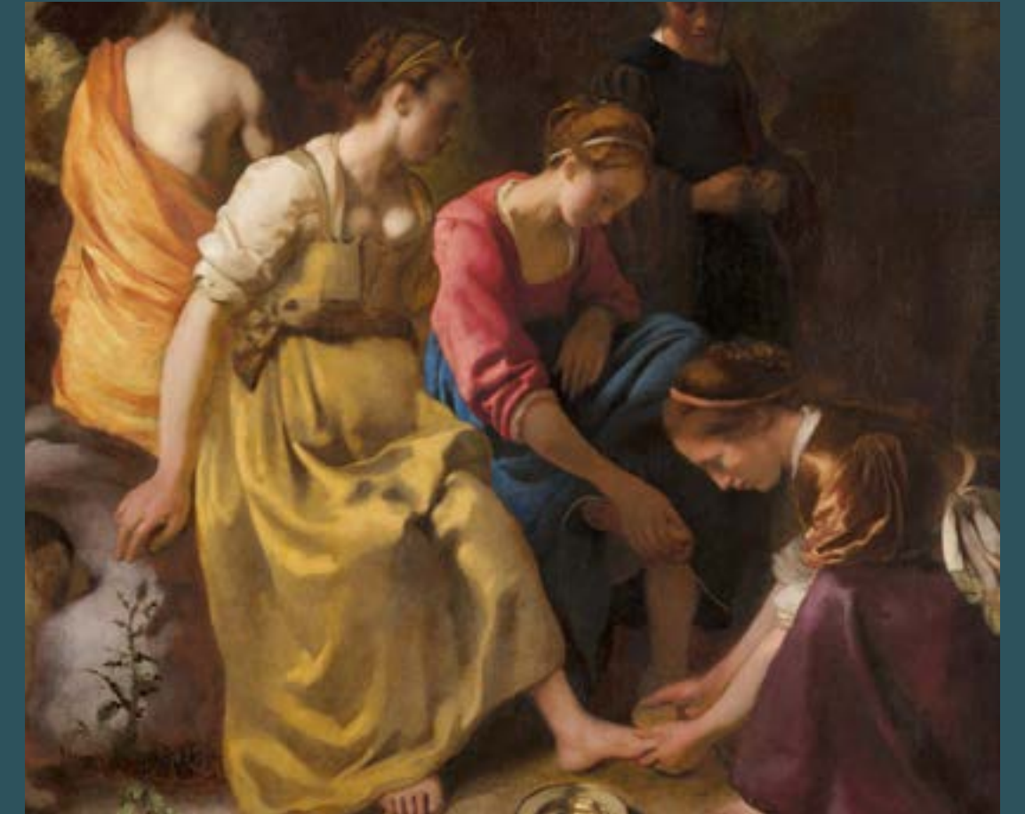
Johannes Vermeer, Diana en haar nimfen , c. 1653-1654