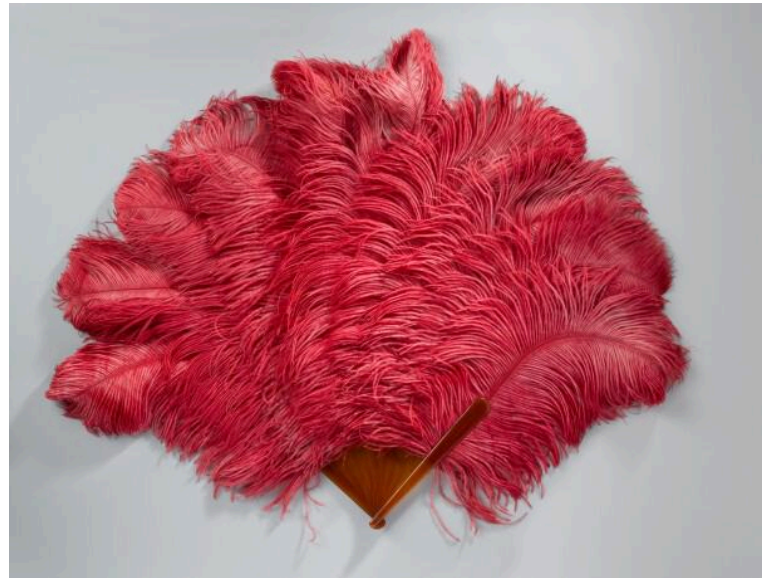
Vouwwaaijer met felroze struisveren op een montuur van onversierde kunststof metschildpadmotief, ca. 1900-1925. Rijksmuseum, Amsterdam

Uit de Bodleian Library in Oxford komt het bijzondere middeleeuwse manuscript met één van de oudste zinnen in de Nederlandse taal, bekend bij alle schoolkinderen omdat hij deel uitmaakt van de Canon van Nederland: 'Hebban olla vogala nestas hagunnan hinase hic enda thu wat unbidan we nu' (Alle vogels zijn begonnen nesten te bouwen, behalve jij en ik, waar wachten we op? ca. 1000-1050)