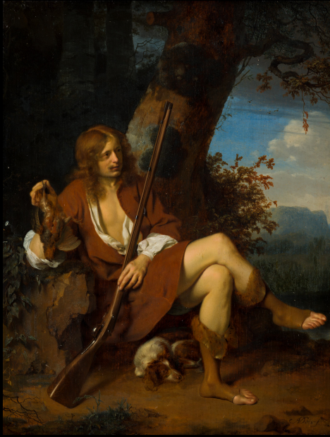
Arie de Vois, Zelfportret als jager, ca. 1660. Mauritshuis, Den Haag