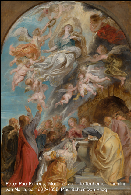
Peter Paul Rubens, 'Modello' voor de Tenhemelopneming van Maria, ca. 1622-1625. Mauritshuis, Den Haag