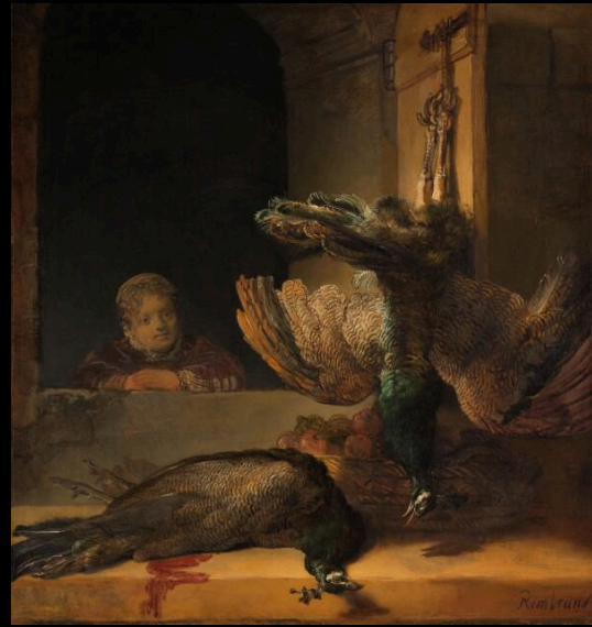
Rembrandt, Stilleven met pauwen, ca. 1639. Rijksmuseum, Amsterdam