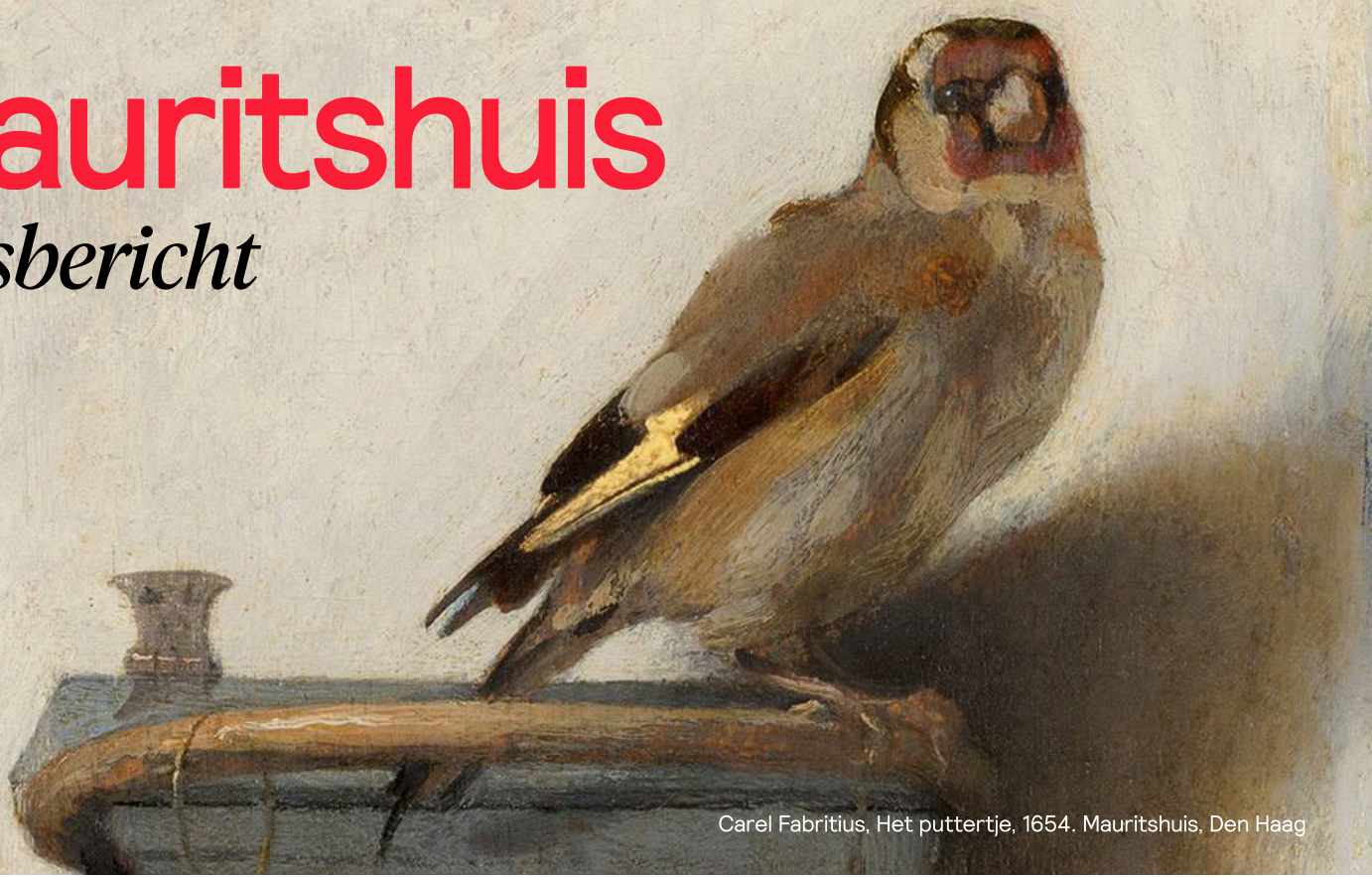
Carel Fabritius, Het puttertje, 1654. Mauritshuis, Den Haag