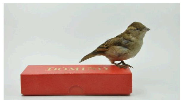
Dominomus, 2005-2025. Natuurhistorisch Museum, Rotterdam

Toen een huismus in 2005 World Domino Day in Leeuwarden dreigde te verstoren nadat zij al 23.000 dominosteentjes had laten omvallen, werd de vogel door een scherpschutter doodgeschoten. Een wereldwijde rel was het gevolg. Constantin Brancusi was zijn leven lang op zoek naar een vorm die de essentie van vliegen in zich droeg. In L'Oiseau dans l'espace is een opwaartse beweging te zien waardoor de gepolijste sculptuur zich lijkt los te maken van de basis.