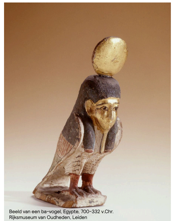
Beeld van een ba-vogel, Egypte, 700-332 v.Chr. Rijksmuseum van Oudheden, Leiden

Op een schilderij van Rubens wordt Maria na haar dood op weg naar de hemel omringd door vele gevleugelde kinderen, cherubijnen genoemd. En een vredesduif siert een beroemd affiche van Pablo Picasso uit 1949 ( La colombe ). Sinds bijbelse tijden is de duif een symbolisch dier: de vogel keert met een olijftak terug naar de Ark van Noach ten teken dat de zondvloed voorbij is.