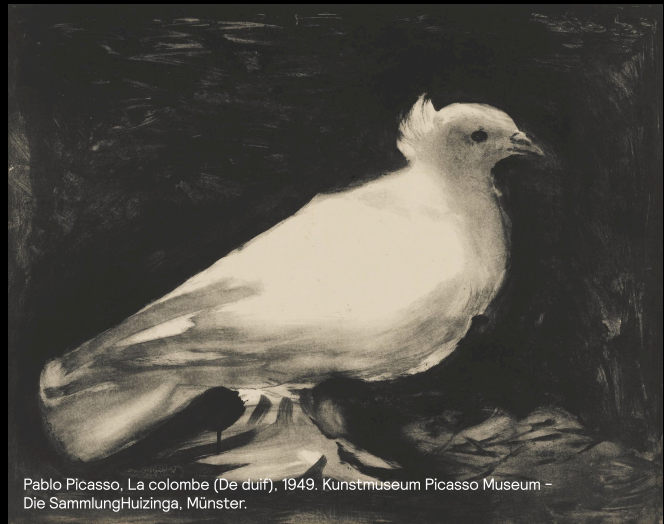
Pablo Picasso, La colombe (De duif), 1949. Kunstmuseum Picasso Museum - Die SammlungHuizinga, Münster.