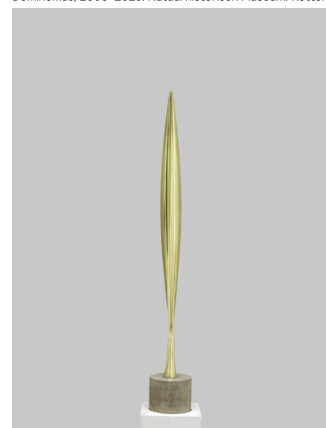
Constantin Brancusi, L'Oiseau dans l'espace (Vogel in de ruimte), 1932-1940. Peggy Guggenheim Collection, Venetië