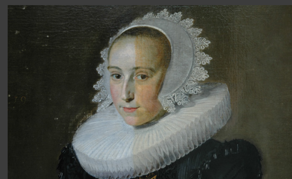
Detail van schilderij van Frans Hals, Portret van Aletta Olycan , 1625, tijdens restauratie.

In 2021 is het ruim 25 jaar geleden dat het restauratieatelier op de zolder van het Mauritshuis werd ondergebracht. Een team van eigen restauratoren houdt zich daar dagelijks bezig met conservering, restauratie en materiaal-technisch onderzoek. In Facelifts & make-overs worden de meest intrigerende restauraties uit de afgelopen twintig jaar uit de doeken gedaan, waaronder schilderijen van Rembrandt, Vermeer, Hals, Steen en Rubens.