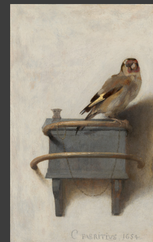
Carel Fabritius, Het puttertje , 1654