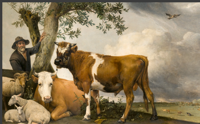
Paulus Potter, De Stier , 1647