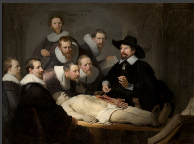
Rembrandt, De anatomische les van Dr. Nicolaes Tulp , 1632