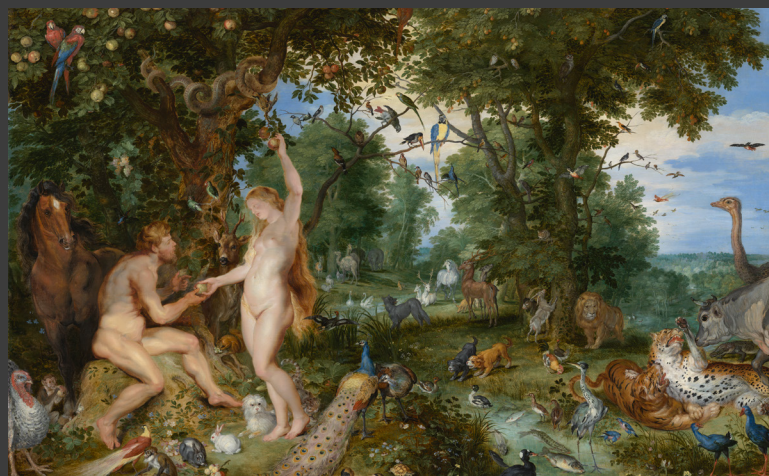
Jan Brueghel de Oude, Peter Paul Rubens, Het aardse paradijs met de zondeval van Adam en Eva , c. 1615