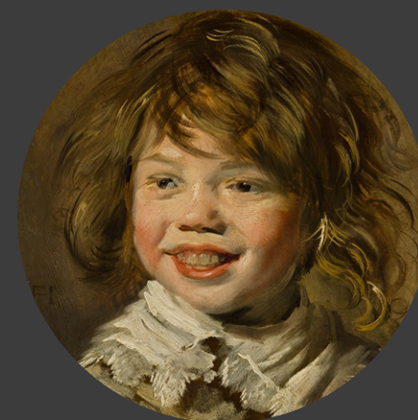
Frans Hals, Lachende jongen , c. 1625