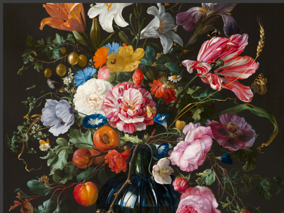
Jan Davidsz de Heem, Vaas met bloemen , c. 1670

Van 10 februari t/m 6 juni 2022 staat het Mauritshuis in het teken van bloemen. Onze collectie bevat talloze kleurrijke en levensechte bloemstillevens, met meesterwerken van Jan Brueghel, Ambrosius Bosschaert, Jan Davidsz de Heem en Rachel Ruysch. Niet voor niets behoren deze beschilderde boeketten tot de meest populaire werken uit de collectie. Samen met bruiklenen van over de hele wereld vertellen we het fascinerende verhaal van dit populaire genre.