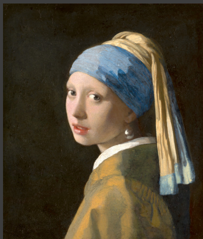
Johannes Vermeer, Meisje met de parel , c. 1665