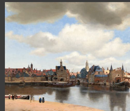
Johannes Vermeer, Gezicht op Delft , c. 1660-1661