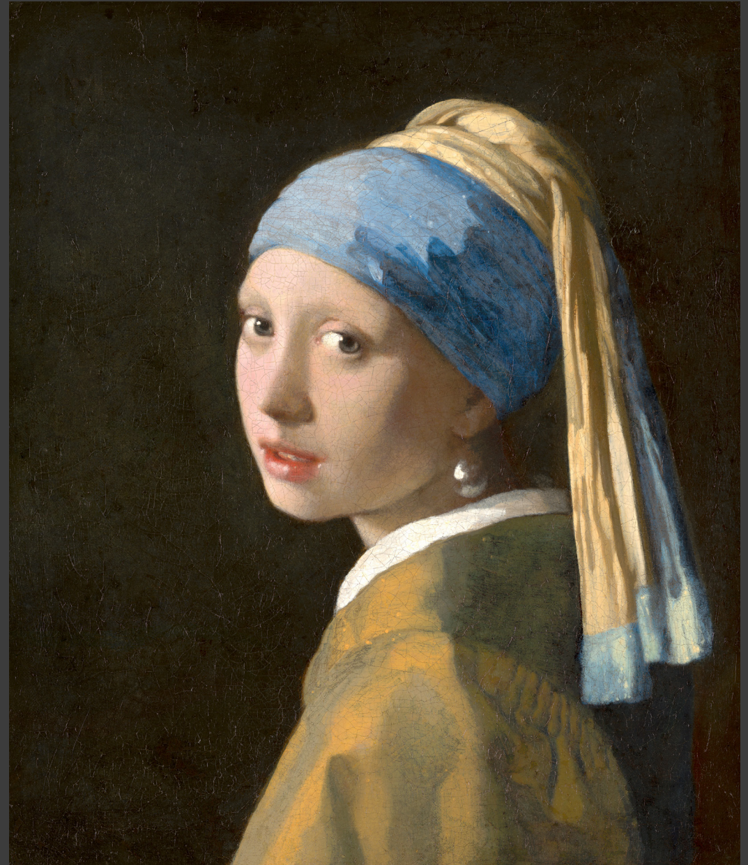
Johannes Vermeer, Meisje met de parel , c. 1665