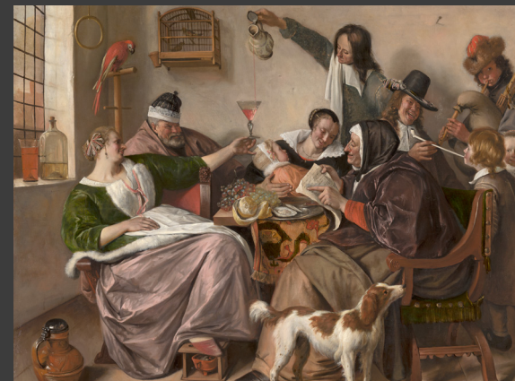
Jan Steen, Soo voer gesongen, soo na gepepen , c. 1668 - 1670

Het jubileumjaar eindigt met een spectaculaire tentoonstelling van internationale allure!