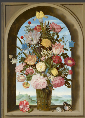
Ambrosius Bosschaert de Oude, Vaas met bloemen in een venster , c. 1618