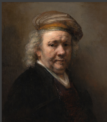
Rembrandt, Zelfportret , 1669