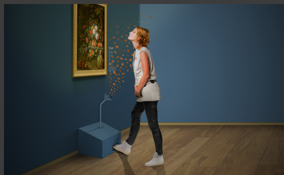
Geurstation met bloemenlucht in tentoonstelling.

Geurende bloemen en parfums, stinkende grachten en onwelriekende lichaamsluchtjes, geur en gezondheid, nieuwe geuren uit de verre wereld (specerijen, tabak, koffie en thee), de verdwenen geuren van bleekvelden, oude ambachten en meer. Valt het leven van de 17 de eeuw in geuren te vangen? Hoe werd geur (en de reuk) uitgebeeld? Het Mauritshuis gaat in deze tentoonstelling op geur-historisch onderzoek uit. Bij de kunst worden diverse historische geuren gebrouwen om de schilderijen in de tentoonstelling tot leven te wekken.